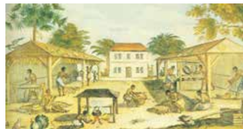
Zwarte slaven in een tabakspantage in Virginia in de 16 e eeuw © University of North Carolina.