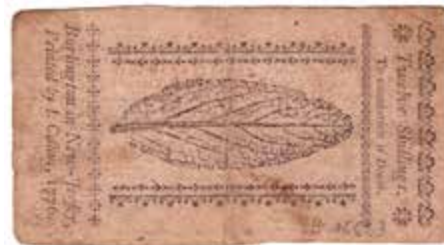
Biljet van 12 shilling uit New Jersey in 1776 met een tabaksblad op de achterkant.

Tussen 1936 en 1946 vertienvoudigde de geldhoeveelheid in Duitsland, terwijl de productie halveerde. Hoewel dergelijke economische ontwikkelingen doorgaans leiden tot een sterke inflatie, heeft Duitsland dit onheil door een beleid van prijsbeheersing en rantsoenering weten te voorkomen. Omdat de officiële rantsoenen echter niet volstonden, ontstond een zwarte markt waar de prijs voor goederen veel hoger kon zijn dan de officiële prijs. De prijs voor boter, suiker, koffie of bloem lag bijvoorbeeld honderd keer hoger. Een groot deel van de bevolking beschouwde deze praktijken als schandig. De meerderheid van de Duitse burgers verkoos dan ook om hun goederen te ruilen in plaats van buitensporige prijzen te betalen. De weigerachtige houding ten opzichte van de Reichsmark vloeide dus niet per se voort uit de depreciatie van de munt, maar uit de vermindering van zijn gebruik (en dus nut) als betaalmiddel.