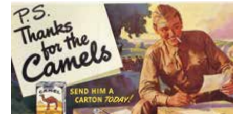
Reclame voor een Amerikaans tabaksmerk tijdens de Tweede Wereldoorlog