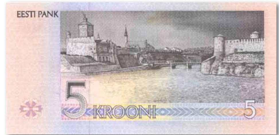
5 couronnes estoniennes - Forteresse Hermann et Jaanilidna

C'est finalement une thématique classique qui a été sélectionnée, des personnalités estoniennes figurant au recto et des monuments célèbres, des bâtiments et des animaux figurant au verso. Les premières pièces de monnaie représentaient des bleuets, emblème de l'Estonie. Plus tard, les bleuets ont été remplacés par le blason aux trois lions estonien.