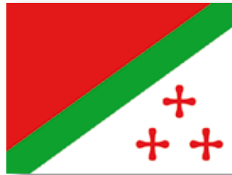
Vlag van de onafhankelijke staat Katanga

Bepaalde lokale betaalmiddelen zoals de Katangakruisen trokken de aandacht van buitenlanders, zowel kolonisten als handelaars. Ze wilden vaak het lokale geld controleren en probeerden het te gebruiken tot hun eigen voordeel. In de 19de eeuw werden de kruisen bijvoorbeeld gebruikt door de grote Arabische koopmannen op hun handelsroutes naar Kenia aan de oostkust van Afrika.