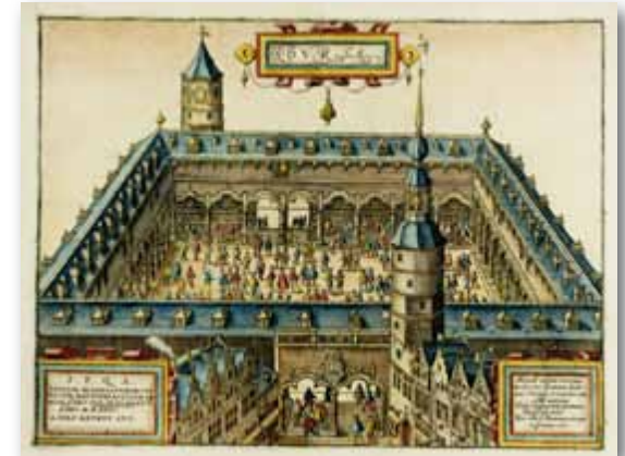
Beurs van Antwerpen

van de buitenlandse markten. In 1370 werden in Brugge op geregelde tijdstippen de wisselkoersen op verschillende steden genoteerd. Rond 1400 kwam er een continue en georganiseerde geldmarkt tot stand met op gezette tijden wisselkoersnoteringen van de meest vooraanstaande handels- en bankcentra in Europa, zoals Barcelona, Venetië, Londen of Parijs.