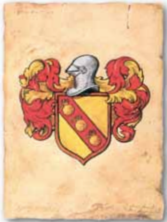
Wapenschild van de familie Van der Buerse

De grondslagen van de huidige beurs werden tijdens de late middeleeuwen in de Noord-Italiaanse steden gelegd. Daar werden de grote basisconcepten van het moderne bank- en beurswezen (bijvoorbeeld de wisselbrief, de vennootschapsvorm en het bankwezen met giraal geld) voor het eerst ontwikkeld en via Brugge in Noordwest-Europa geïntroduceerd. Brugge speelde van begin af aan een cruciale rol in het ontstaan van de aandelenhandel. Door het verval van de jaarmarkten van Champagne en hogere transportkosten zochten de Italianen via Brugge een andere weg naar Noord-Europa. Brugge lag in de veertiende eeuw op het kruispunt van twee grote handelsimperia